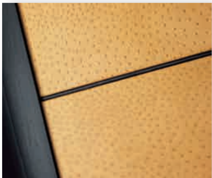
Particolare della porta in ecopelle.

Il fascino di nuove essenze, abbinate a linee essenziali e arricchite da dettagli di grande eleganza. IPEA propone una porta caratterizzata da una struttura in listellare e da un pannello centrale liscio in essenza, in vetro o nell'esclusiva soluzione in ecopelle. Elementi distintivi comuni sono le cerniere a scomparsa registrabili e l'innovativa chiusura magnetica.