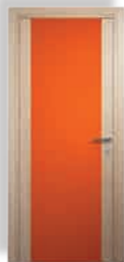
vetro cieco colorato arancio