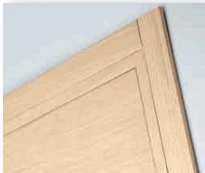
Particolare della porta vista del lato a tirare

L'industrializzazione della porta non può assolutamente escludere la cura del particolare. Per IPEA questo è alla base di tutto il percorso di ricerca e di lavorazione. Con il risultato di offrire una porta bella, innovativa e curata nel minimo dettaglio. In questo contesto la soluzione “versa” presenta una porta dal design semplice e dalle linee minimali, in essenza o laccata provvista di cerniere a scomparsa registrabili e chiusura magnetica.