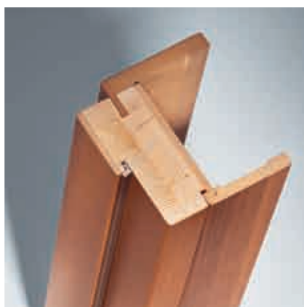
Sezione telaio e coprifilo