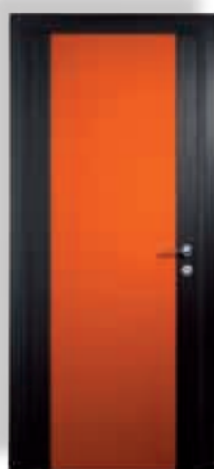
vetro cieco colorato arancione