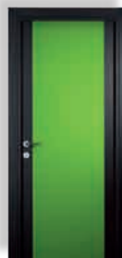
vetro cieco colorato verde