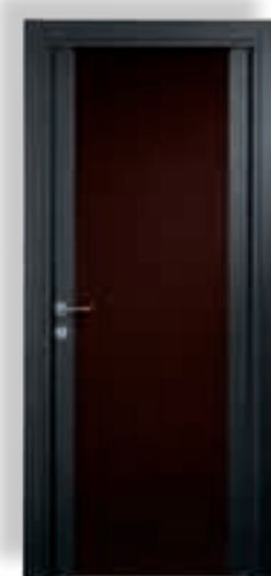
vetro cieco colorato moro