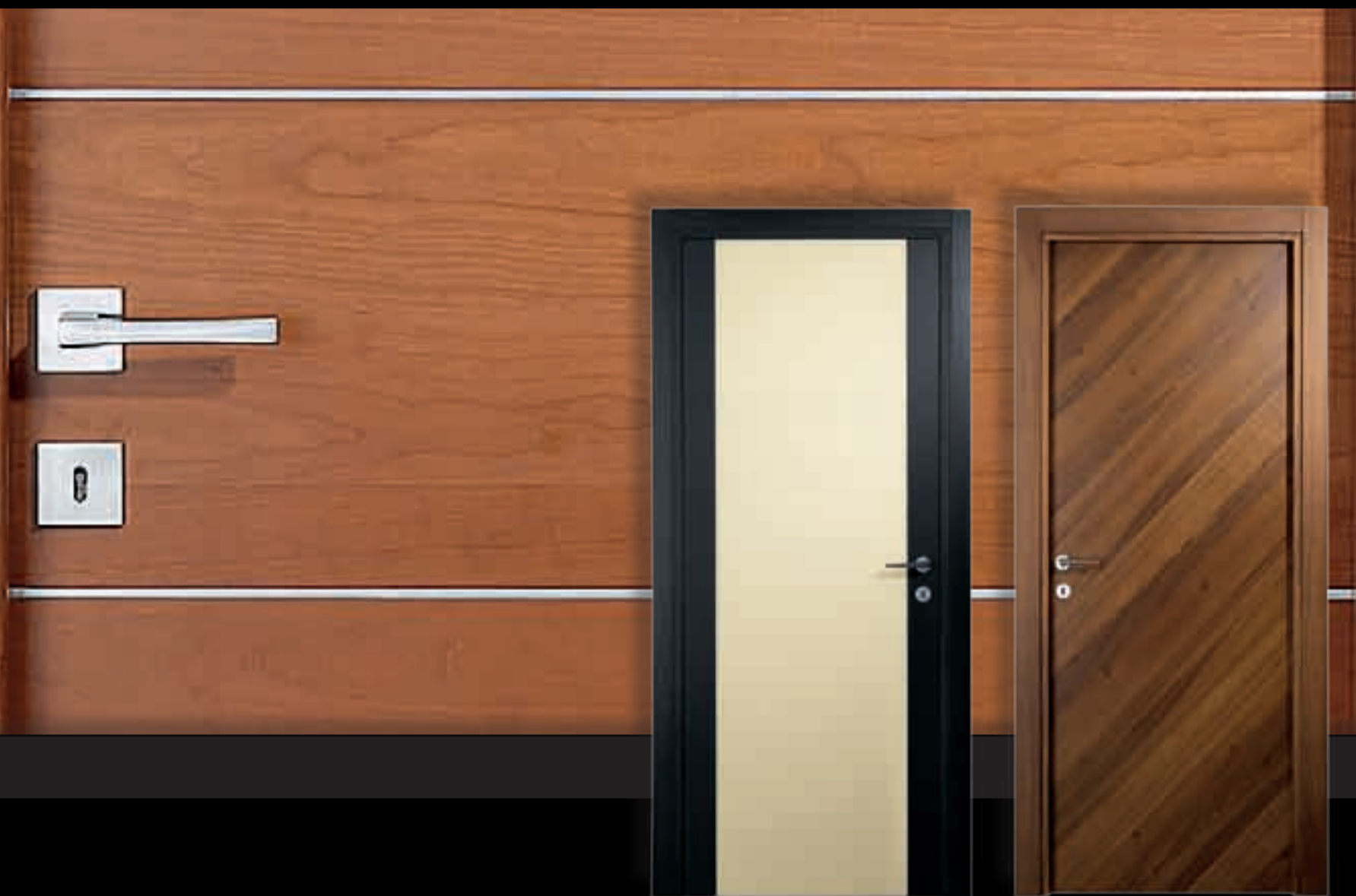
Linea "EXTRO" Linea "VERSA"