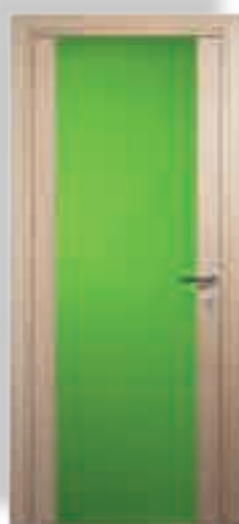
vetro cieco colorato verde