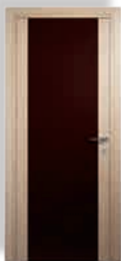
vetro cieco colorato moro