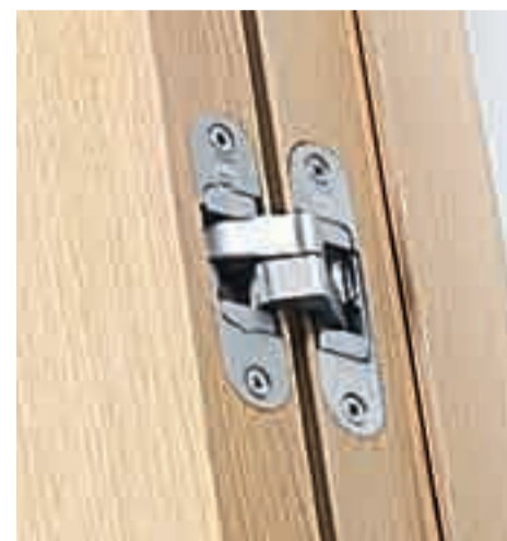
particolare della cerniera