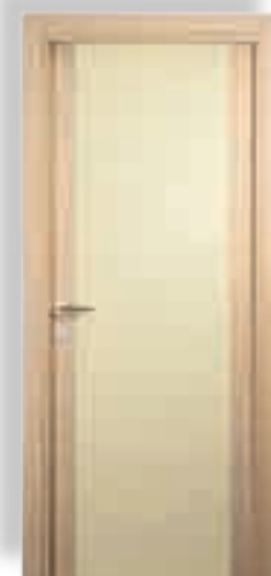
vetro cieco colorato sabbia