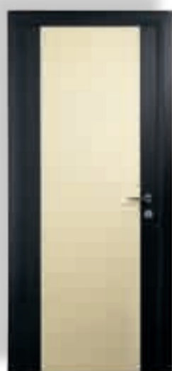
vetro cieco colorato sabbia